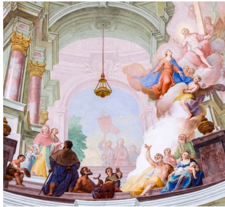
Mittlere Kuppel der Wallfahrtskirche: Maria bittet Jesus um Heilung der Kranken

Die nächsten Vorabendmessen mit anschließendem